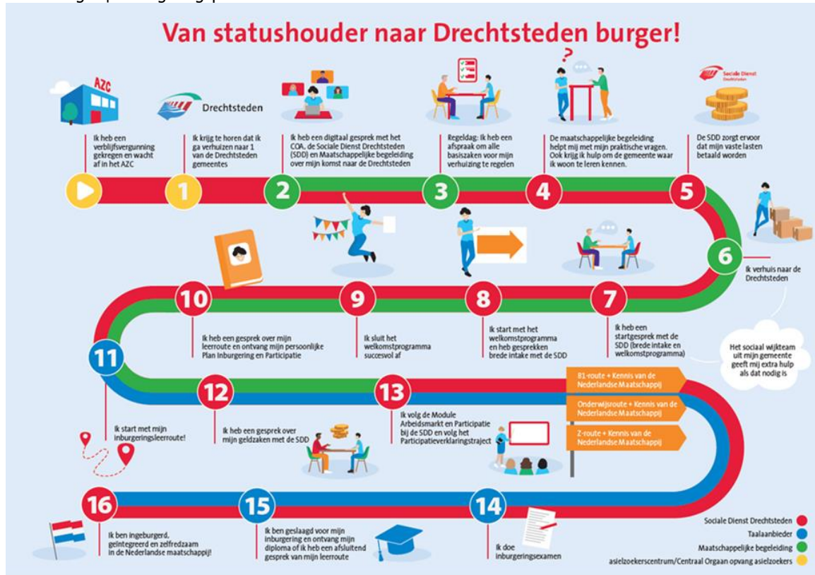
Afbeelding 1 | Inburgeringsproces

De inburgeringsketen loopt vanaf het moment van de warme overdracht met het COA tot en met behalen van het inburgeringsdiploma (gevolgd door verdere integratie in de samenleving). Een groot deel van de inburgeringsketen betreft de onderdelen/taken die door de SDD op basis van de DVO worden uitgevoerd (zie Hoofdstuk 3). In aanvulling op die onderdelen is de keten verder opgebouwd uit inburgeringsvoorzieningen (leerroutes) en maatschappelijke begeleiding (incl PVT, financiële zelfredzaamheid).